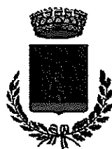
Comune di San Romano in Garfagnana