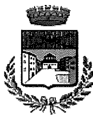
Comune di Piazza al Serchio